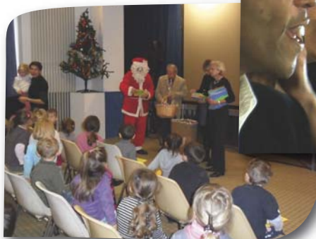
Arbre de Noël des écoles