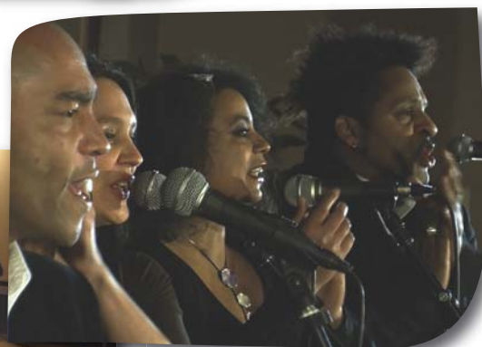
Concert de Gospel Rivers à l'église