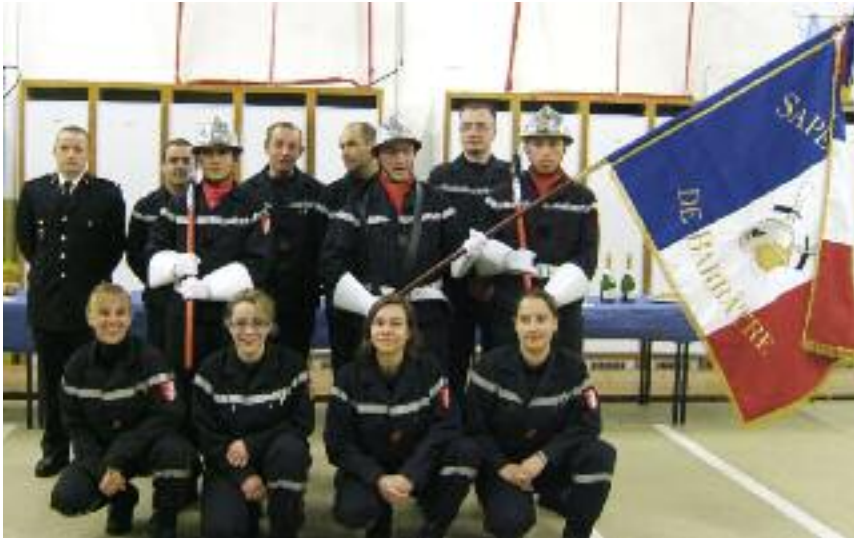
Bénédiction de notre drapeau le 29 février 2008

Le centre de Secours de Barbâtre compte 16 Sapeurs Pompiers Volontaires actifs, l'idéal pour notre Centre de Secours serait de comptabiliser 25 Sapeurs Pompiers Volontaires hommes ou femmes, pour mener à bien nos missions de secours et de sécurité.