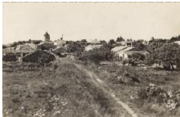
La Frandière au début des années 50. image extraite de l'article « La Vie rurale à la Frandière, à Barbâtre, dans les années 1950 » de Célestin Palvadeau, dit Tintin Paru dans le N°148 de la LETTRE AUX AMIS

Juillet & Août Mercredi et Vendredi de 14h30-17h00