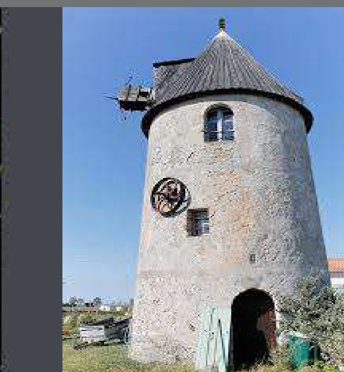
Une structure urbaine variée, un centre-bourg à dynamiser