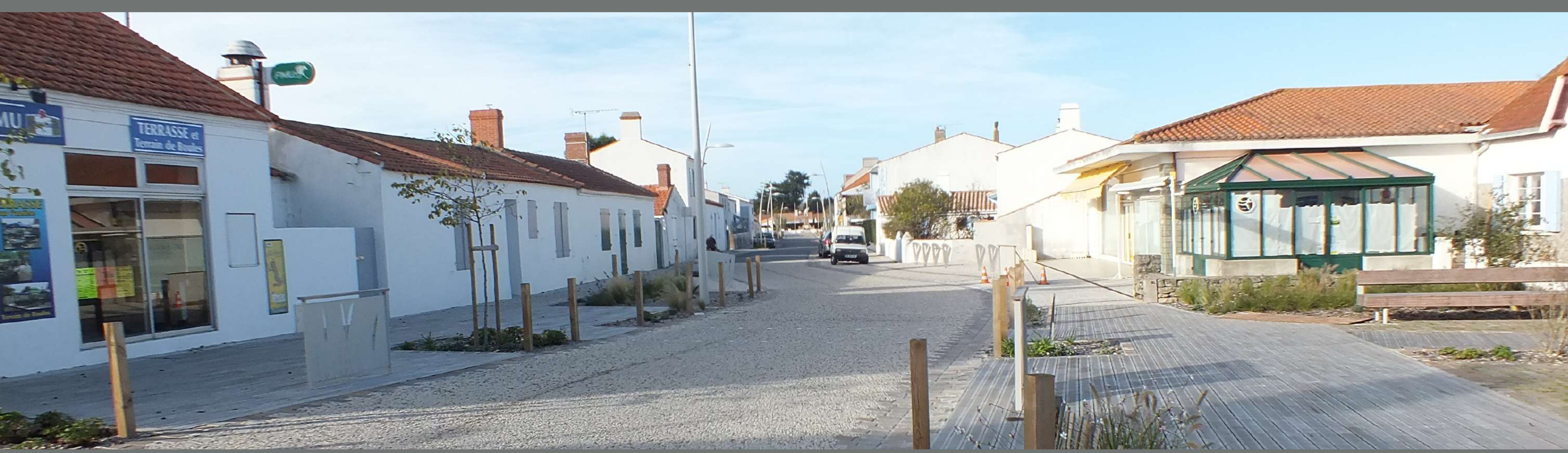
Un cordon dunaire à protéger, un front urbain à valoriser