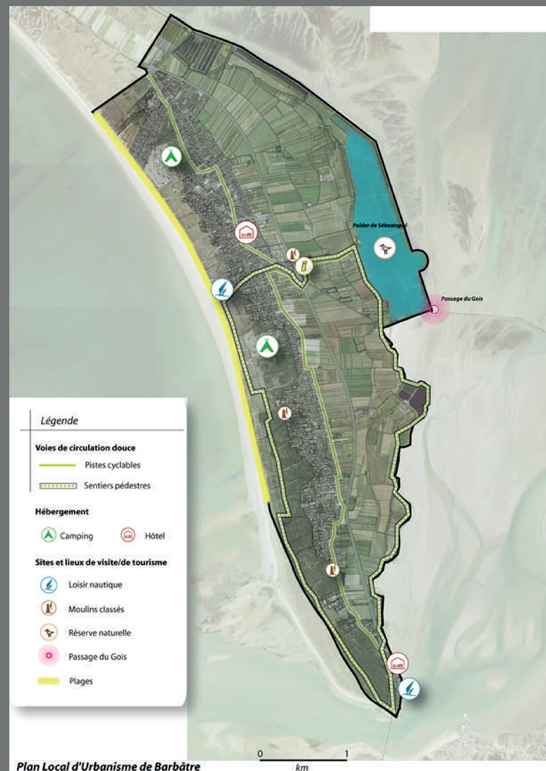
Plan Local d'Urbanisme de Barbâtre