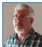
Conception & Impression © www.graffocean.com

La P'TITE BALISE est disponible en mairie et dans les principaux commerces.