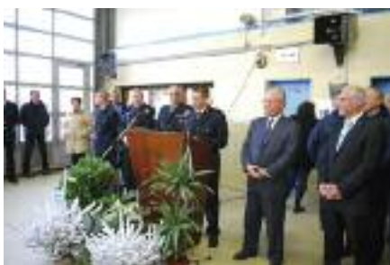
Cérémonie de la Sainte Barbe le 13 décembre 2008

Le Centre de Secours de BARBATRE a fêté ses 35 ans d'existence le 13 décembre dernier. A cette occasion le Colonel Michel MONTALETANG avait fait le déplacement pour constater le commencement des différents travaux de rénovation et de peinture.