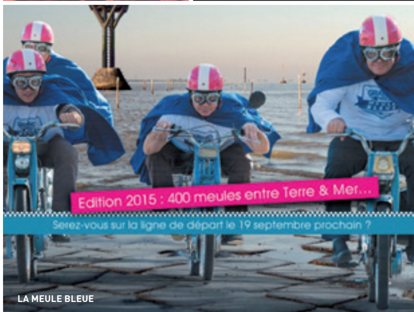
LA MEULE BLEUE