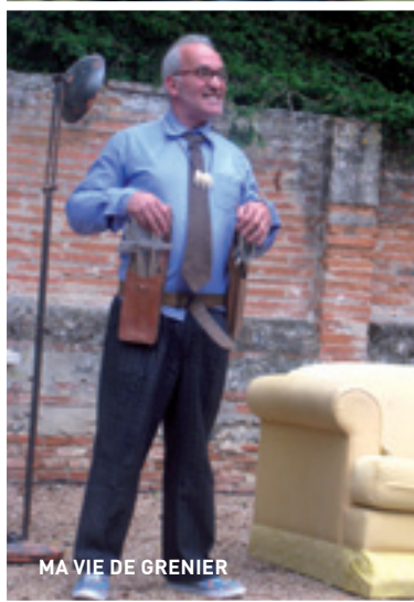
MA VIE DE GRENIER