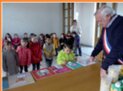
La classe des TPS-PS-MS en déplacement à la mairie le mardi 18 mai pour voter.

L'équipe songe déjà à passer la commande pour la rentrée prochaine. En attendant les superbes livres couverts par les soins de Mme Damour sont déjà déposés à la bibliothèque de l'école.