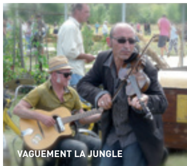
VAGUEMENT LA JUNGLE

L'été est lancé, et avec lui s'accompagne comme chaque année une multitude de spectacles, concerts, expositions, animations. Vous trouverez en mairie et sur le site internet de la commune les brochures, et détails de l'ensemble des manifestations se déroulant à Barbâtre. En attendant voici un rapide descriptif des éléments majeurs pour les mois d'août et Septembre.