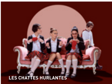
LES CHATTES HURLANTES