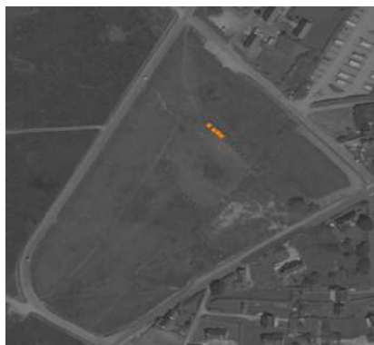
( ex. : alignement de menhirs)

Pour cette servitude, le générateur et l'assiette se superposent et se confondent.