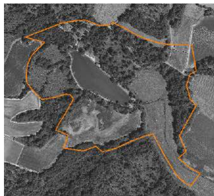
(ex. : parc remarquable)